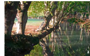
2. Vallée de l'Eure