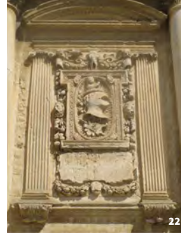
22. Détail de grotesque © Claire Lise Creissen