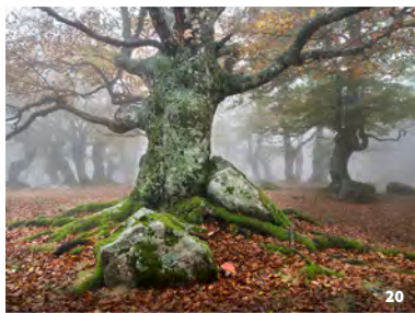
20. Exposition Fayard