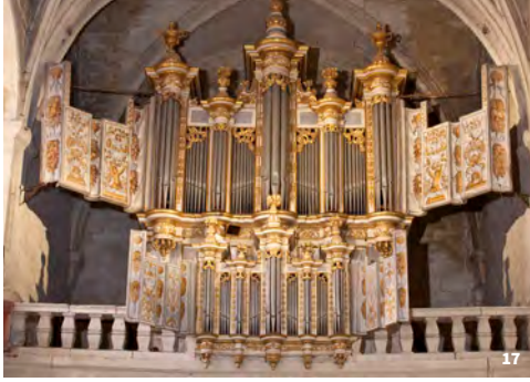
17. Orgues St Théodorit