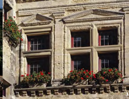
1. Fenêtre hôtel particulier

La Maison du patrimoine est ouverte au public tous les matins de 9h à 12h.