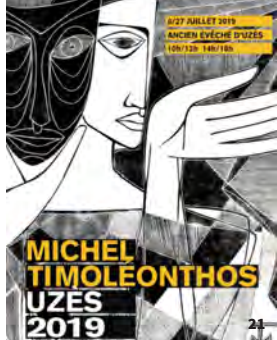
21. Exposition Michel Timoleonthos