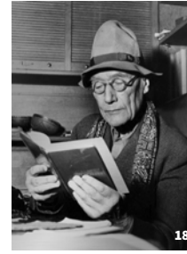
18. André Gide © Fondation Catherine Gide